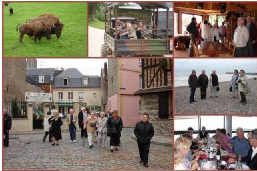
Sortie annuelle des Séniors