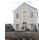
Mairie de Gressey