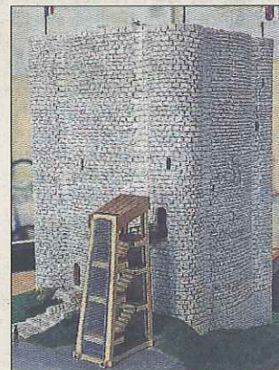
HOUDAN. Une exposition permet de découvrir les futurs travaux de restauration du donjon.