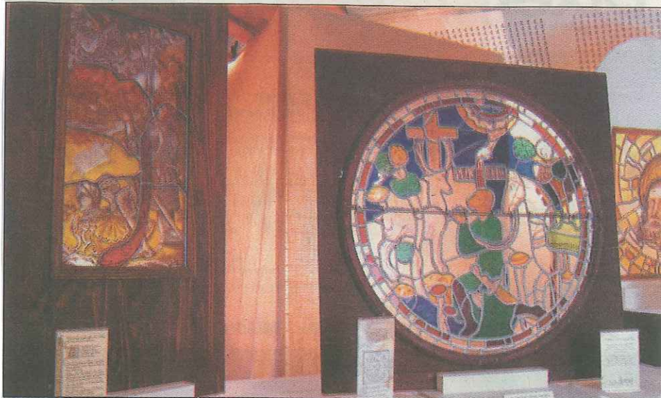
Des vitraux de tous styles et des bijoux sont en expo-vente.

VITRAUX ET BIJOUX sont en exposition-vente à l'office du tourisme de Houdan jusqu'au 18 septembre.