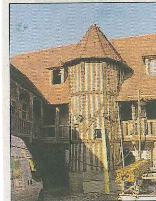
HOUDAN. La tourelle de l'Écu enserrant l'escalier distribuant les coursives.

> Hostellerie de l'Écu de France. 37-39-41 rue de Paris, anciennement rue de Paris. 78550 Houdan