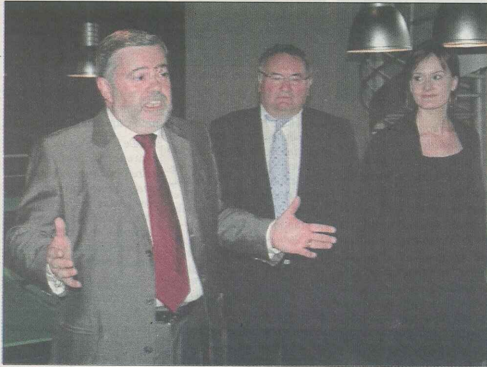
■ Le PDG de Bowling-Star va inviter les enfants des écoles de Houdan au bowling.