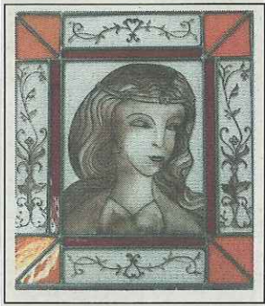
Le couvres de Nantes