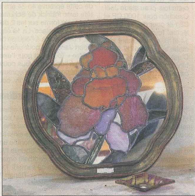
HOUDAN. Le vitrail traité en rosace solaire

Elle se reconverte, et reprend des études. Fascinante mutation, qui lui fait découvrir l'art du vitrail. Elle contribue alors, à la restauration de panneaux anciens. Elle se nourrit de ces témoins du passé et collabore à leur sauvegarde, en leur offrant une seconde vie. Insatiable, « ... aller au-delà des apparences du verre... ». Plaide-t-elle avec un joli sourire. La fusion du verre la captive, « ... le vitrail, malgré sa surface plane, offre un