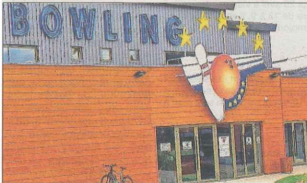
HOUDAN. Entrée du Bowling au centre de loisirs Hédolia

Il aura fallu quelques mois de réflexions pour créer cet espace de jeu, avant de pouvoir lancer une boule sur l'une des douze pistes avec l'ambition de faire un « Strike ». Les résultats de cette réflexion sont exem-