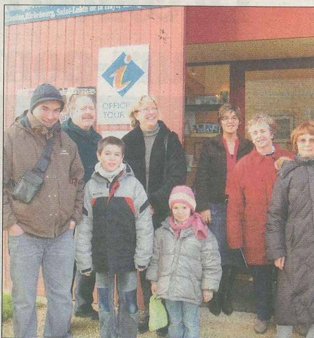
Les habitants de Houdan sont allés à la rencontre de leur histoire tout en participant au Téléthon.

C'est ainsi qu'ils sont allés à la rencontre de la petite et de la grande histoire, où se mêlent anecdotes et faits de tous les jours. Histoire du donjon, naturellement (dont la réouverture est prévue en 2012) mais également de l'église et des nombreuses auberges anciennes qui bordent encore la rue de Paris. Là plupart des participants sont venus pour savoir ce qui se cache derrière ces monuments et édifices qu'ils