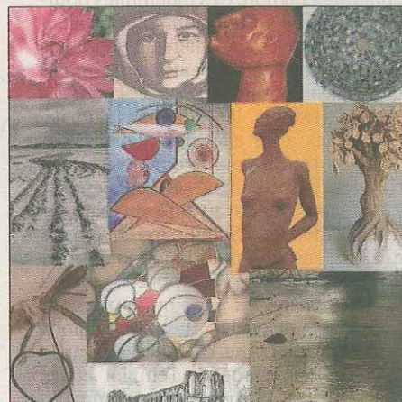
L'office de tourisme réunit les artistes qui ont exposé cette année

Renseignements : 01.30.59.53.86 ou otph@cc-payshoudanais