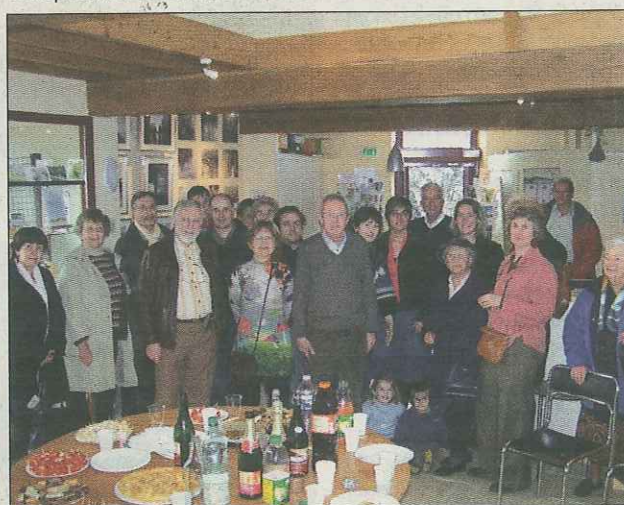
Artistes et invités étaient présents lors du vernissage.

•Exposition rétrospective, jusqu'au 18 décembre à l'office du tourisme du pays houdanais, 4, place de la Tour, 78550 Houdan, du mardi au samedi de 10h à 12h30 et de 15h à 17h. Entrée libre