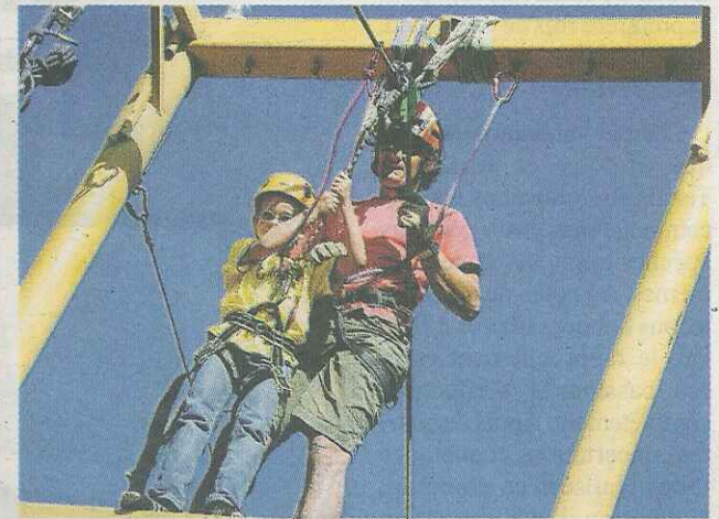
■ La descente en tyrolienne a eu du succès.