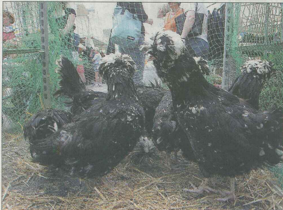
HOUDAN. La société avicole qui œuvre à la sauvegarde de la poule de Houdan fête son centenaire cette année.

> 25, 26 et 27 Septembre dans le centre-ville de Houdan.