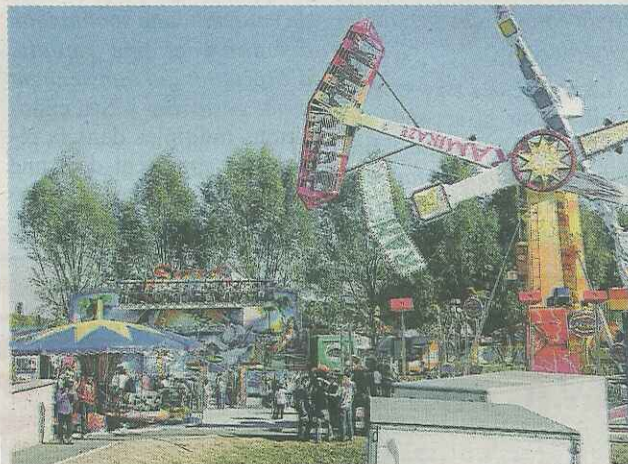
■ Au programme : fête et sensations fortes.