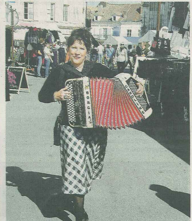
■ Sur un air de guinguette.