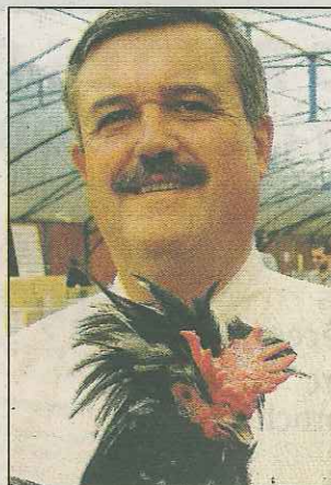
■ Bernard Adriant.

La poule de Houdan se reconnaît à sa crête double, dite en feuille de chêne et à sa huppe de plumes sur la tête. Elle existe en plusieurs variétés de couleurs, la plus connue étant à plumage noir, parsemé de tâches blanches (noir caillouté blanc). C'est avec La Faverolles la seule poule de France pourvue de pattes à cinq doigts. Son histoire remonte au XIV e siècle. On la servait aux rois de France.